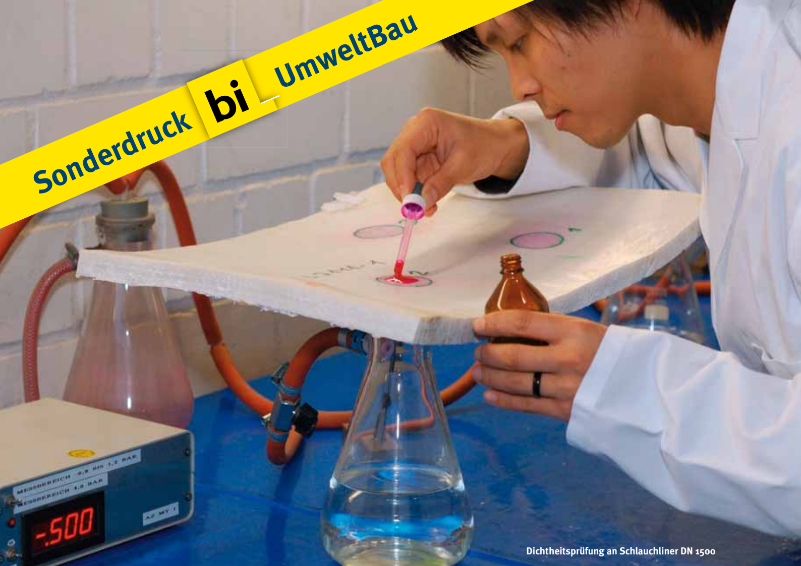
Dichtheitsprüfung an Schlauchliner DN 1500