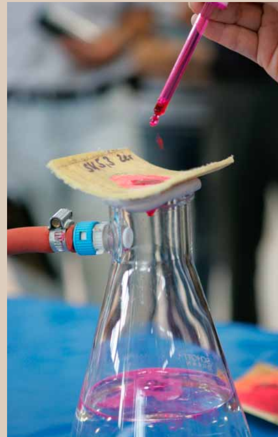
Ill. 3 : L'eau (rouge) s'égoutte à travers la paroi ; le liner est perméable

Les résultats obtenus par cette catégorie ne sont similaires que pour l'épaisseur de paroi. Les résultats du PRV, en revanche, sont sujets à des variations moindres. L'épaisseur de paroi constitue ici une exception, l'éventail des résultats obtenus étant particulièrement large.