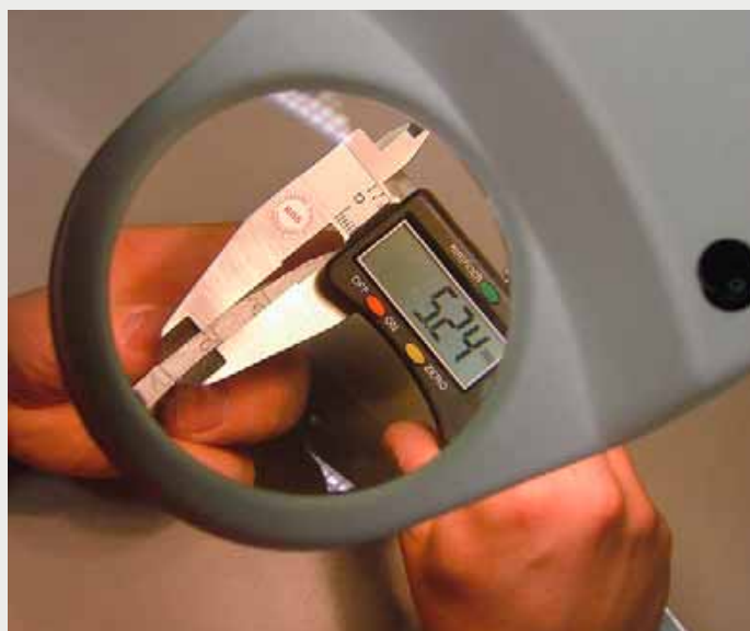
Afbeelding 3: Meting van de liner-wanddikte