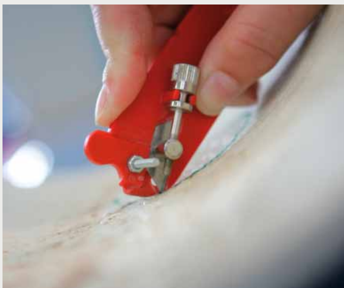
Afbeelding 2: Insnijden van de binnenfolie met begrenzing van de diepte van de snede

– Niet gewaardeerd daar te weinig liner-monsters